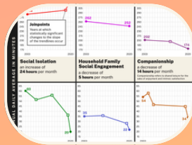
Tendencias y significados