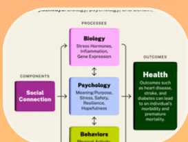
Conexión y Biología, Psicología y Conducta