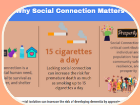
Por qué es tan importante la conexión social

¿NO TIENES TIEMPO PARA VER UN VIDEO? HAZ CLIC EN LAS IMÁGENES DE ABAJO PARA VER LA INFOGRAFÍA DE CADA PARTE.