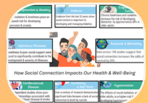
Conexión social y salud y bienestar