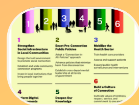
Los “seis pilares” y la perspectiva del OCW