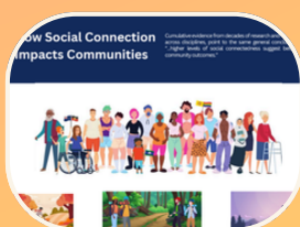
Cómo la conexión social afecta a las comunidades