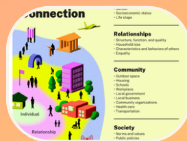
Factores que moldean la conexión